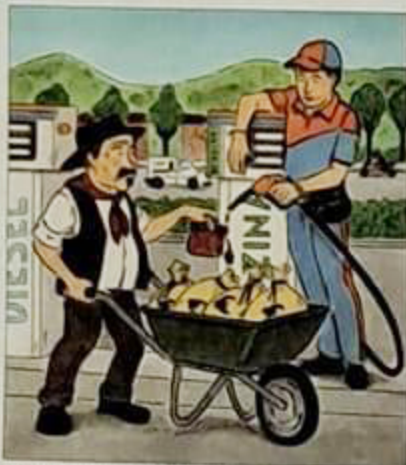
Con la guerra in Ucraina l'è carsù gas e benzina.

tòt i Smèmbar un dè cèr j ha ciàp so, j è andé e' mèr