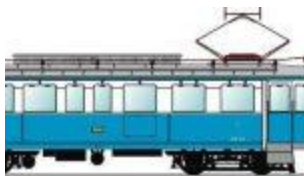
tipologie AB 01 - AB 02 - AB 03 solo l'AB 01 (malridotta) e l'AB 03 (restaurata e fu

Foto assai interessante, trovata sul sito STAGNI WEB e che ritrae il trenino biancazzurro della fu ferrovia SAN MARINO – RIMINI all'uscita della Galleria CERBAIOLA nei pressi del cimitero di DOMAGNANO