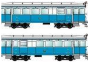
Esseggeri con SERVIZIO POSTA 162