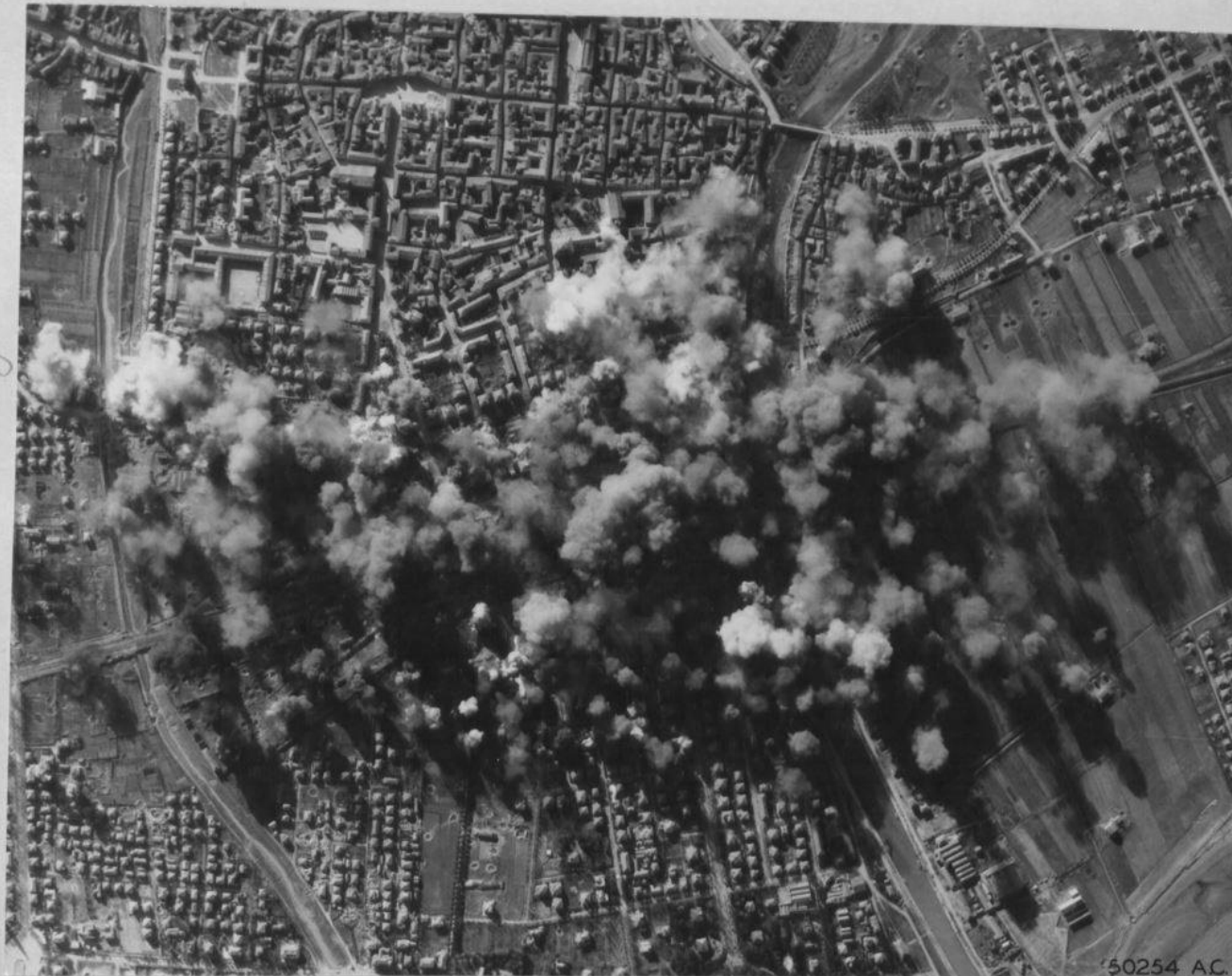
Foto di Rimini, oltre 350 bombardamenti aerei

Scusate se mi sono intrufolato nella vostra bella pagina su Rimini, ma mi sono sentito il dovere di pubblicare queste drammatiche e spettacolari fotografie che ritraggono alcuni bombardamenti aerei subiti dalla città. Da anni mi dedico nel tempo libero alla ricerca di informazioni sul passaggio della guerra nella mia area (Mondolfo-Marotta in Provincia di Pesaro) e proprio in questi giorni mi sono imbattuto in innumerevoli foto di Rimini, ed ho scoperto che proprio Rimini ha subito oltre 350 bombardamenti aerei con il risultato di ritrovarsi rasa al suolo per l'80%. La presenza dell'importante snodo ferroviario e il transito di truppe tedesche con relativi materiali ha provocato l'intensificarsi dei raid aerei alleati sulla città, e le bombe purtroppo spesso finivano fuori bersaglio. Il mio pensiero va alle vittime civili di questi bombardamenti che rende drammaticamente "moderne" queste foto.