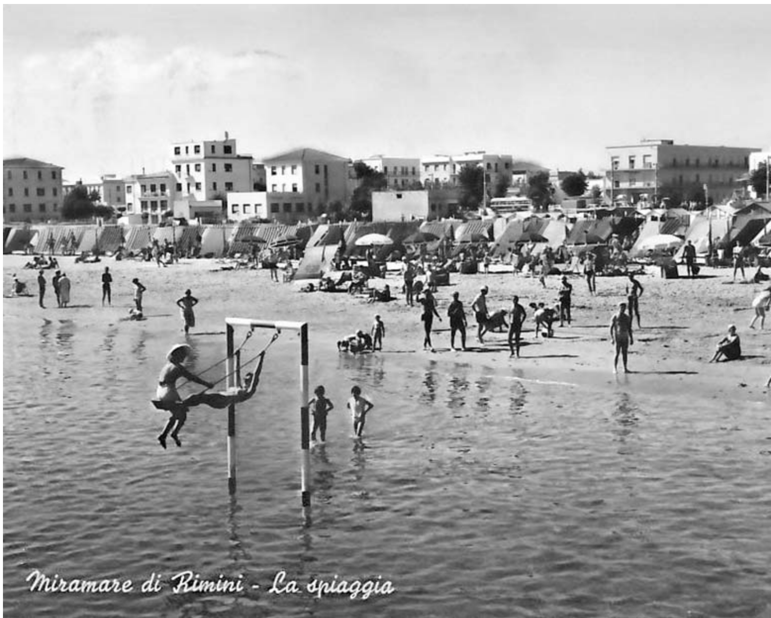
Miramare di Rimini - La spiaggia