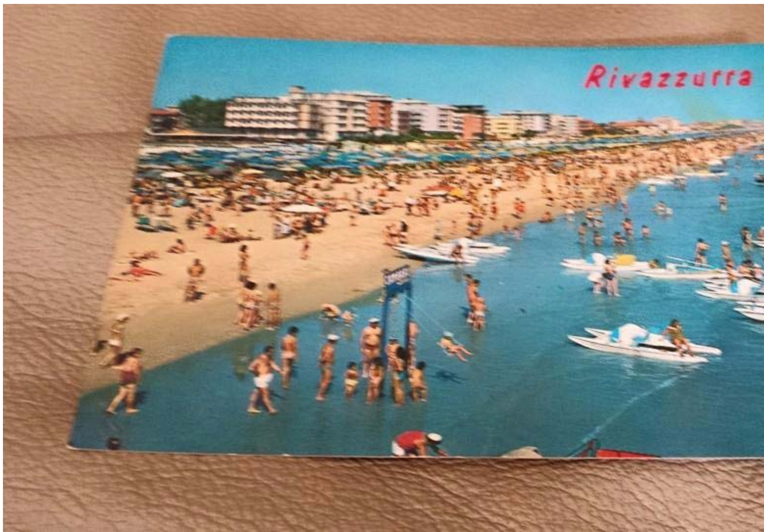
Guido Pasini, 3 Ottobre 2014: Ho ritrovato questa serie di fotografie fatte dal sottoscritto all'alba di un giorno non definito del Luglio 1966