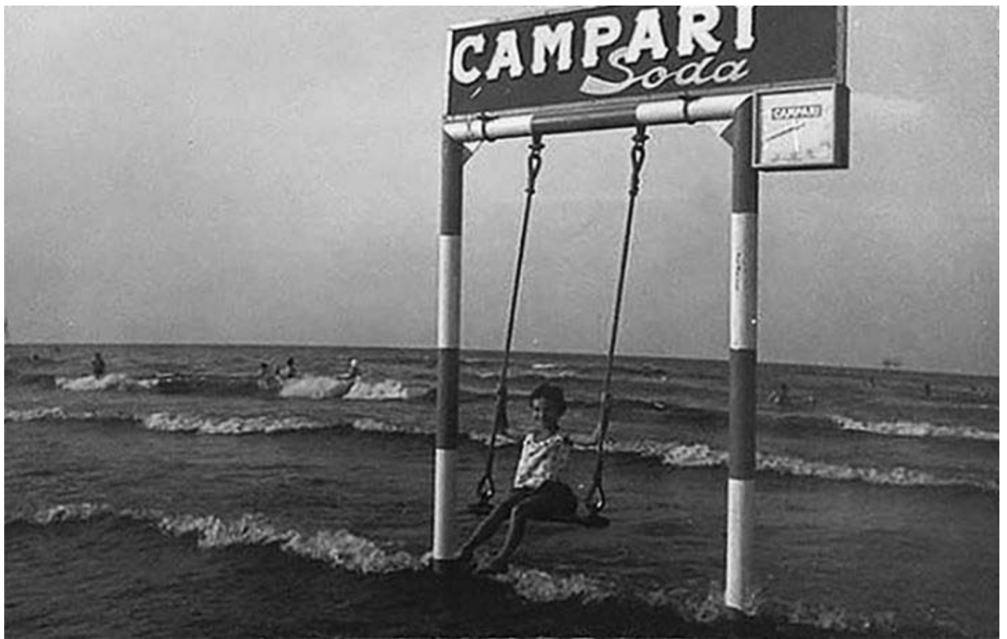
Anna Rita Grossi, 9 Settembre 2015: ... Viserbella '70, come cambiano i tempi!