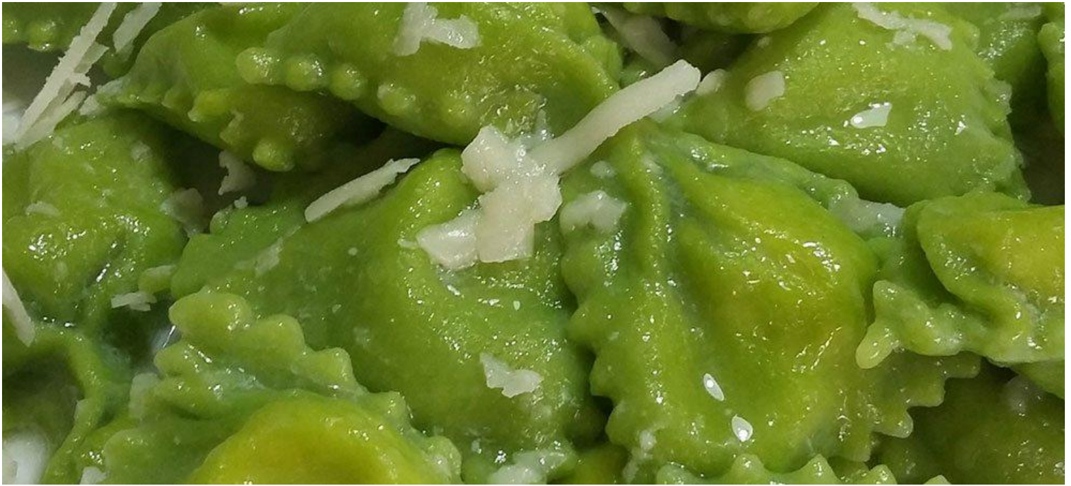
Farfalle ripiene al formaggio di fossa