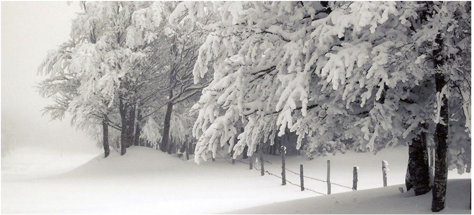
Il Nevone del 2012 in Romagna