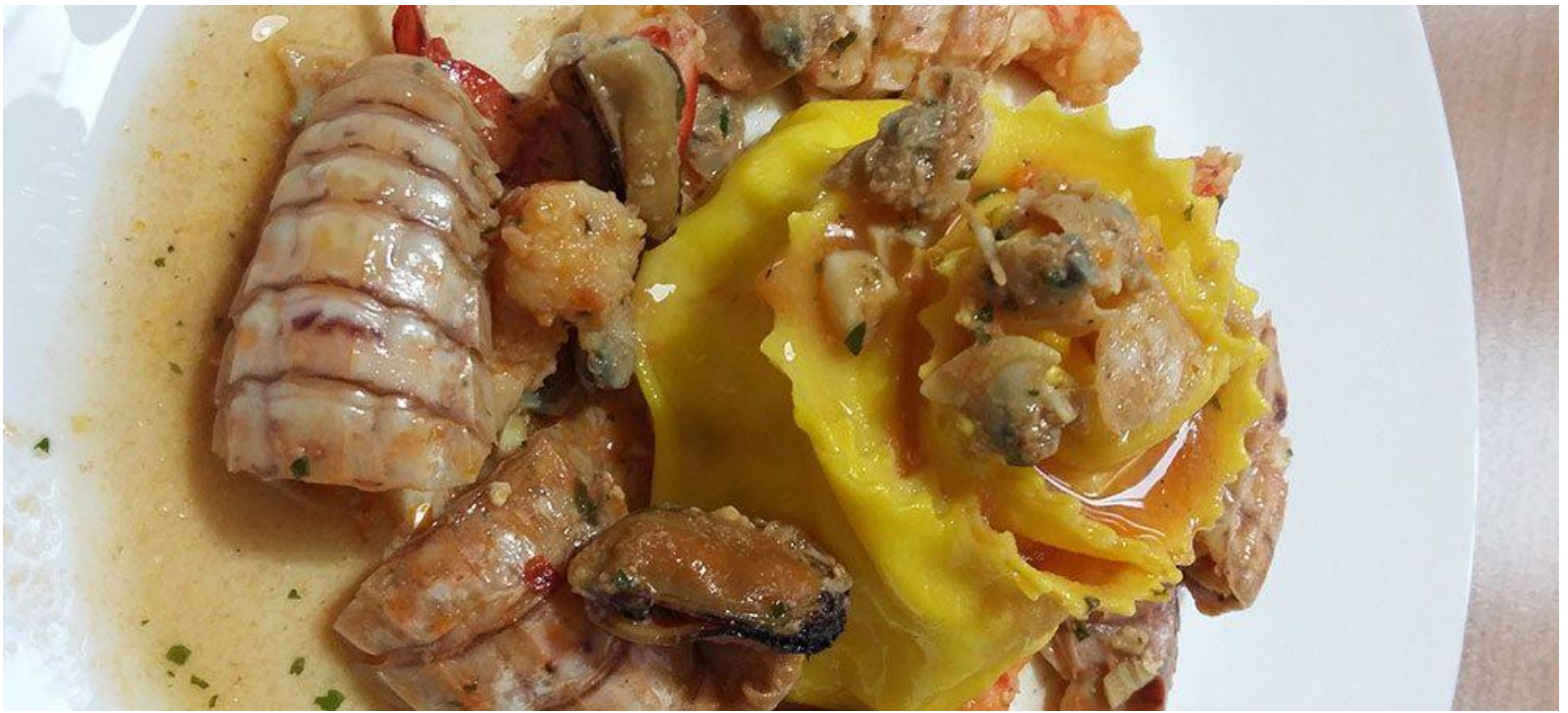
Rose di pasta con sugo di pesce