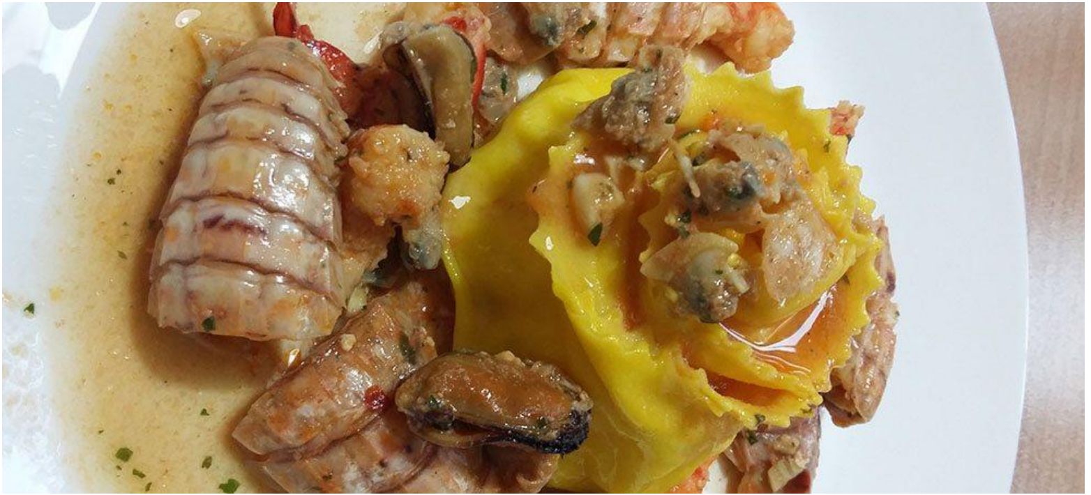
Rose di pasta con sugo di pesce