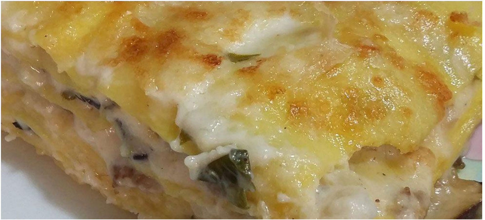
Lasagne con salsiccia e funghi porcini