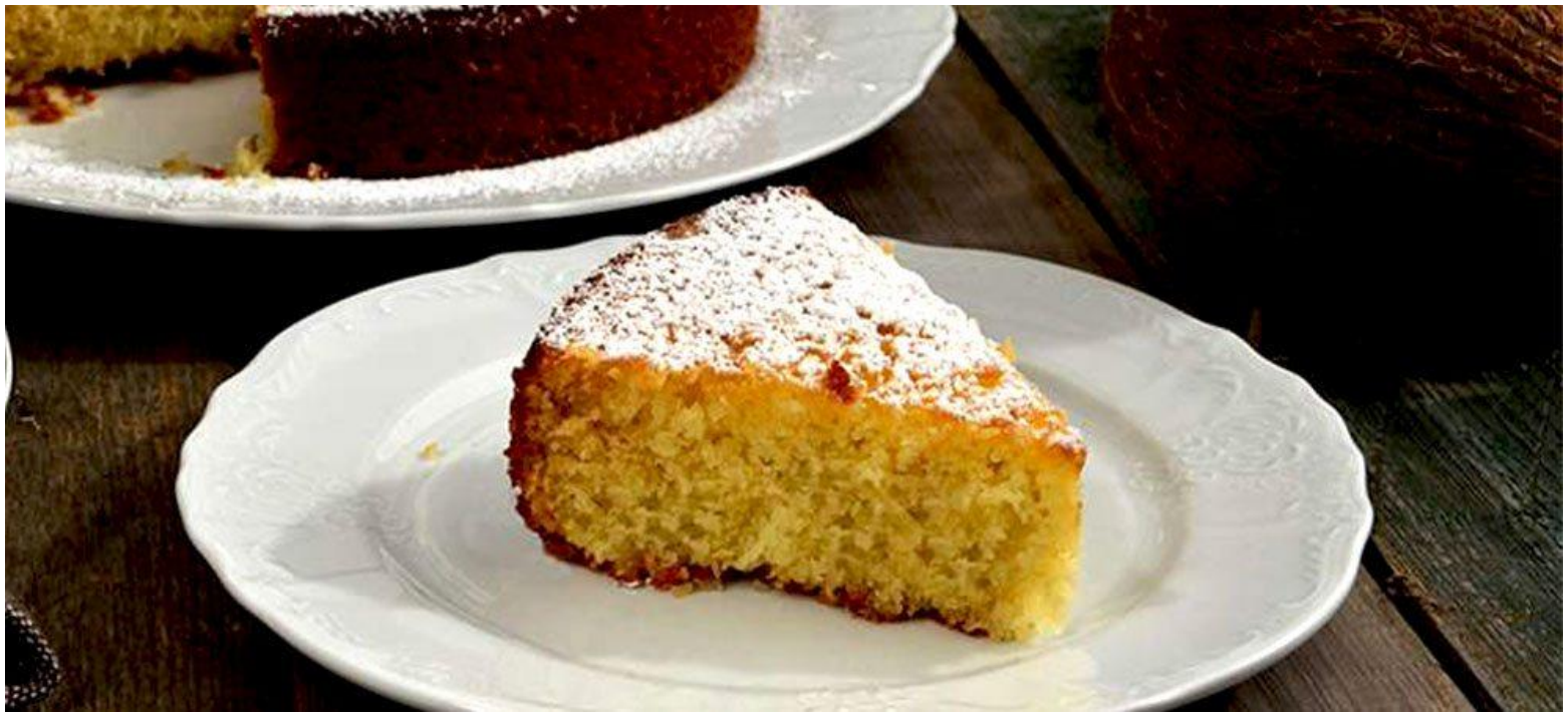
Torta al cocco